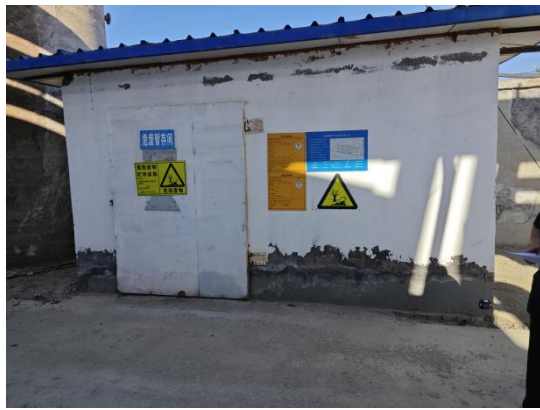
危险废物暂存间 20m 2