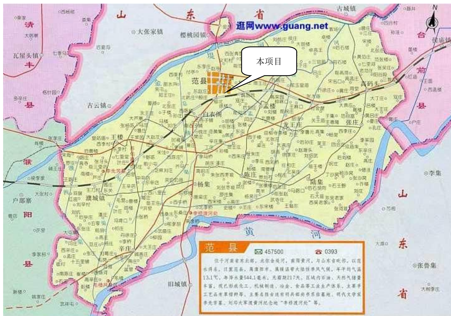
附图一 项目地理位置图