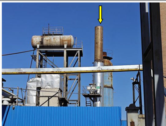
导热油炉 15m 排气筒