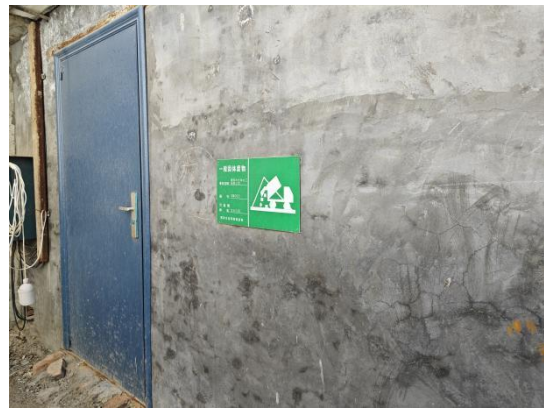
一般固体废物暂存间 25m 2