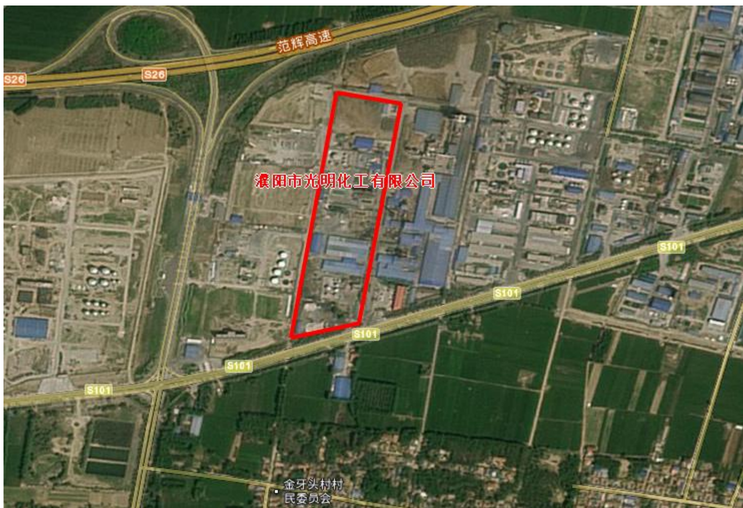
附图二 项目周边环境示意图