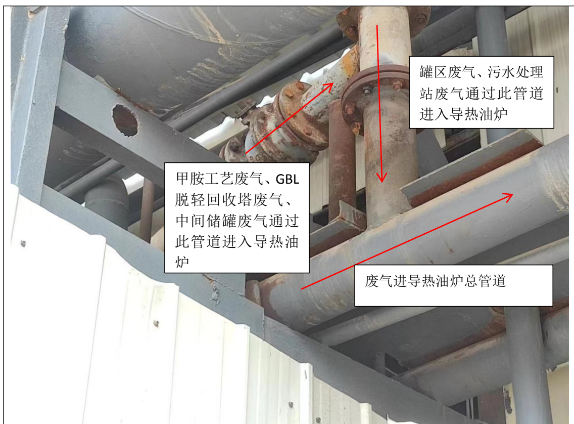
废气进导热油炉总管道