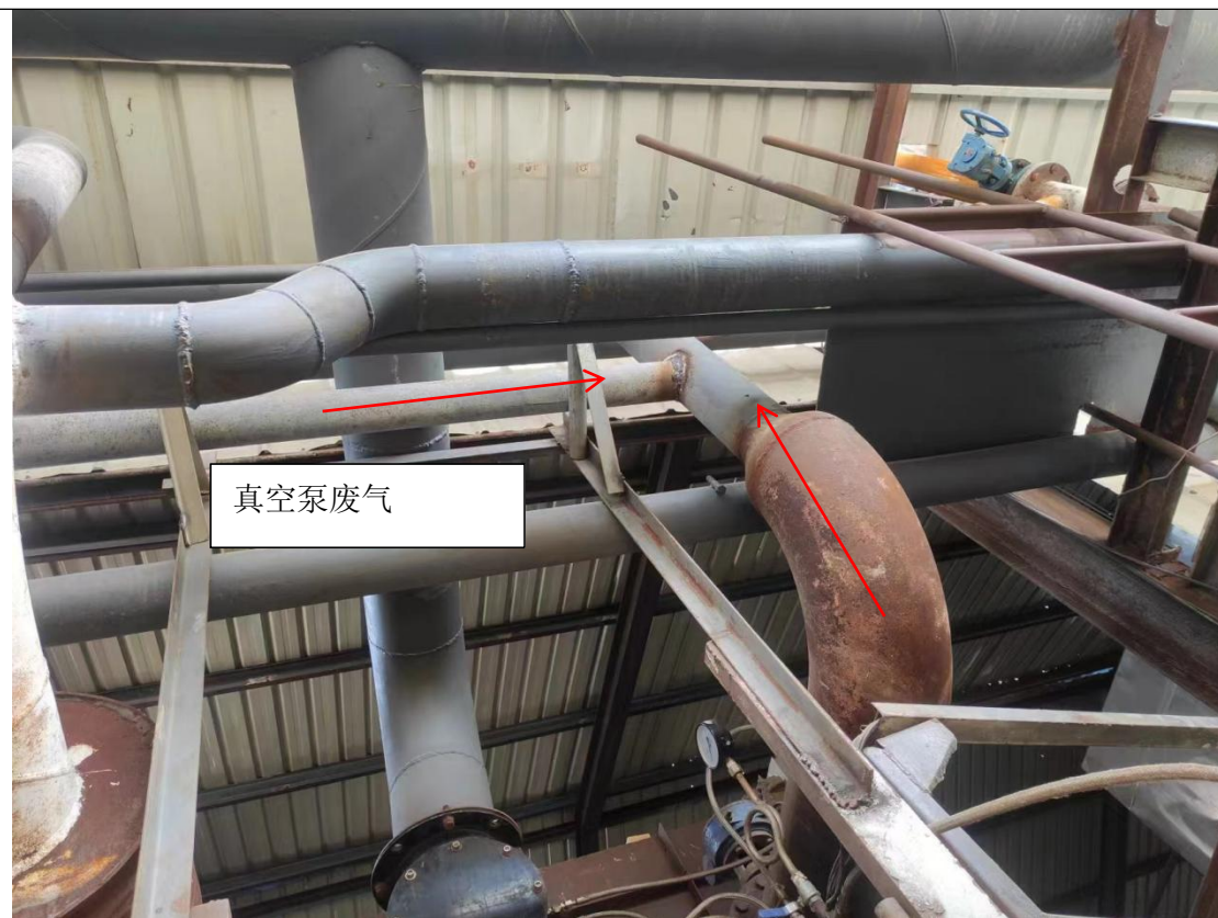
甲胺工艺废气、GBL脱轻回收塔废气、中间储罐废气通过此管道进入导热油炉