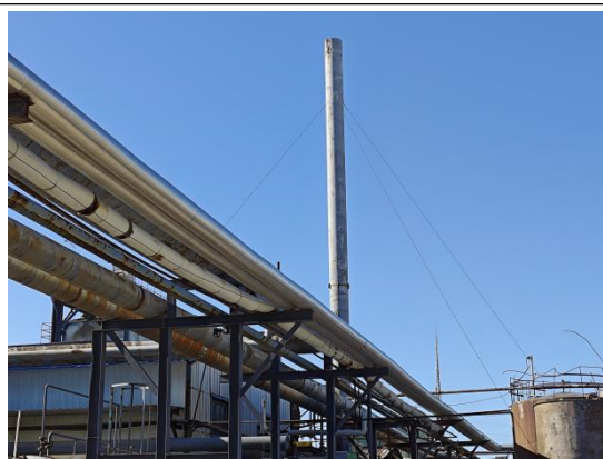
焚烧炉 25m 排气筒