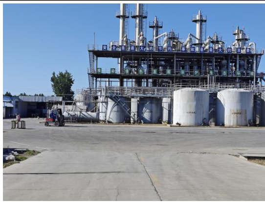
新建 NMP 联合生产装置