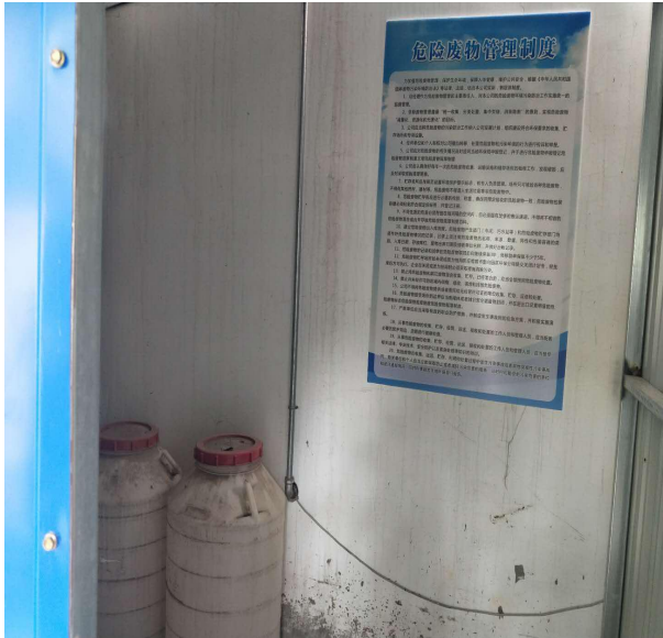
附图四 规范危废间管理