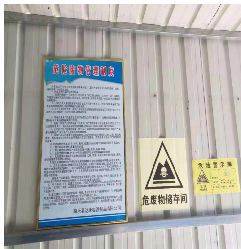
危废管理制度、标识