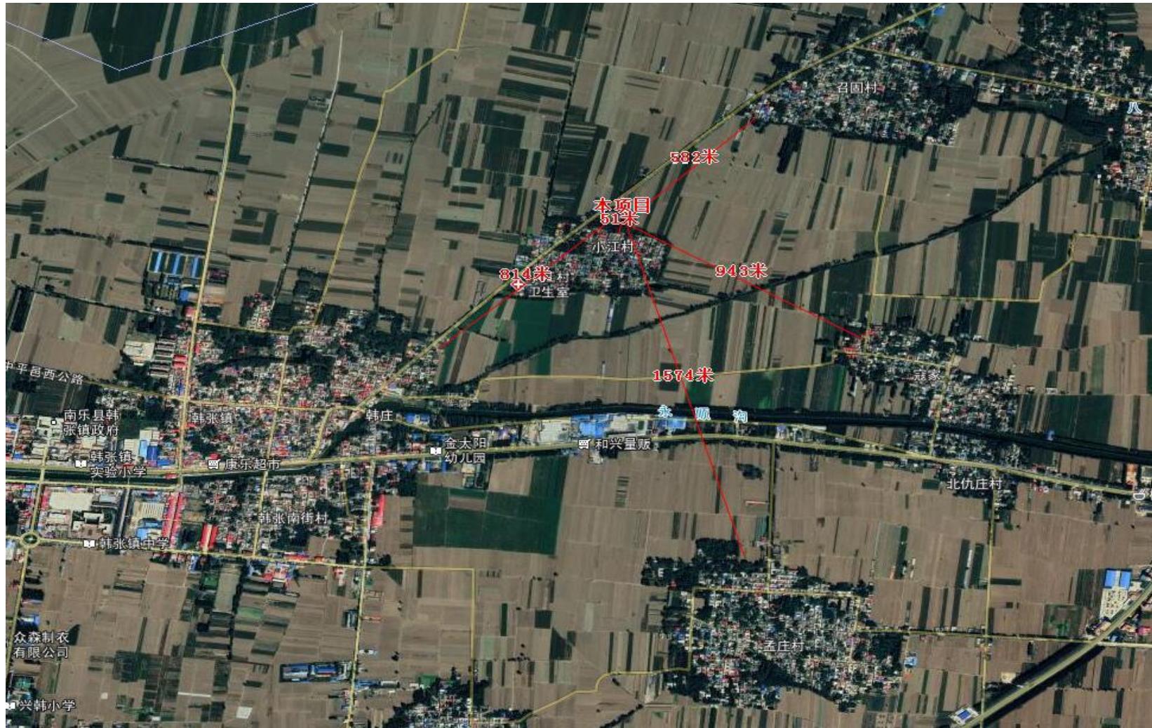
续附图一 本项目周边关系示意图