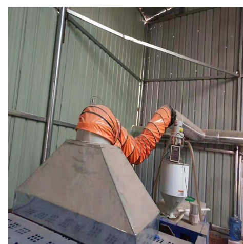
整改后废气收集管道