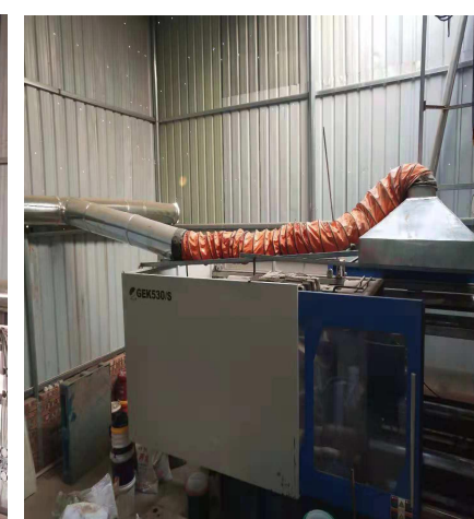
整改后废气收集管道