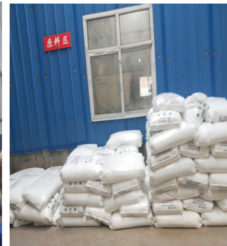
车间物料分区存放