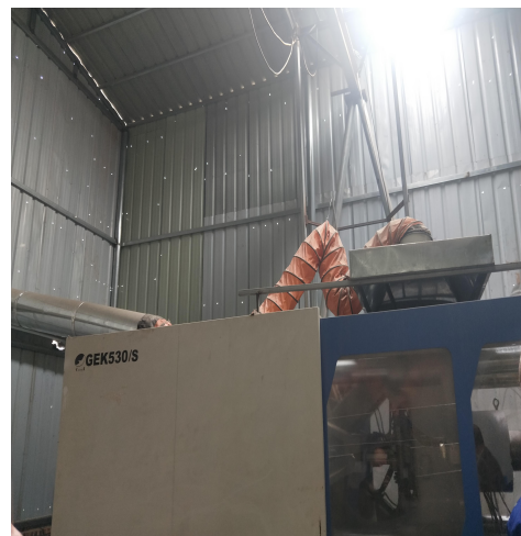
整改前废气收集管道